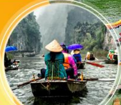
บั้งหิบบังห์