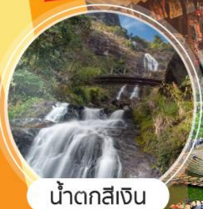
น้ำตกสีเงิน